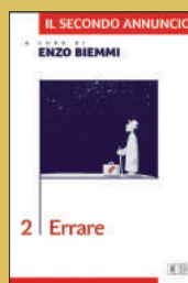
Errare EDB, 2015