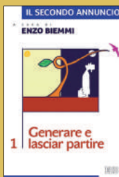
Generare e lasciar partire EDB, 2014