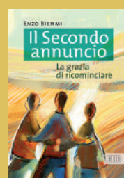
Il secondo annuncio. La grazia di ricominciare EDB, 2011