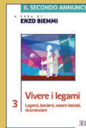
Vivere i legami. Legarsi, lasciarsi, essere lasciati, ricominciare EDB, 2016