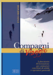
Compagni di viaggio. Laboratorio di formazione per animatori, catechisti di adulti e operatori pastorali EDB, 2003